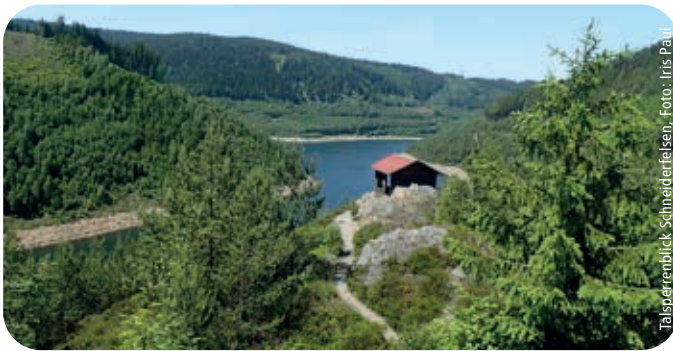
Talsperrenblick Schneiderröhren

Infos: www.rennsteig-schwarzatal.de / www.outdooractive.com