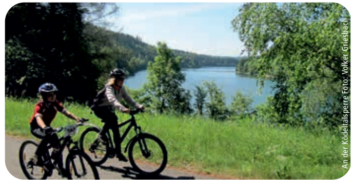
An der Ködeltalsperre

Infos: www.nordhalben.de / www.frankenwald-mobil.de